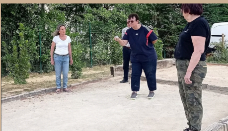
Terrains de pétanque & aire de jeux enfants