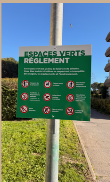
Règlement Espaces verts