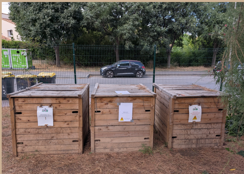
3 sites de compostage Compostage | collinesdestanove