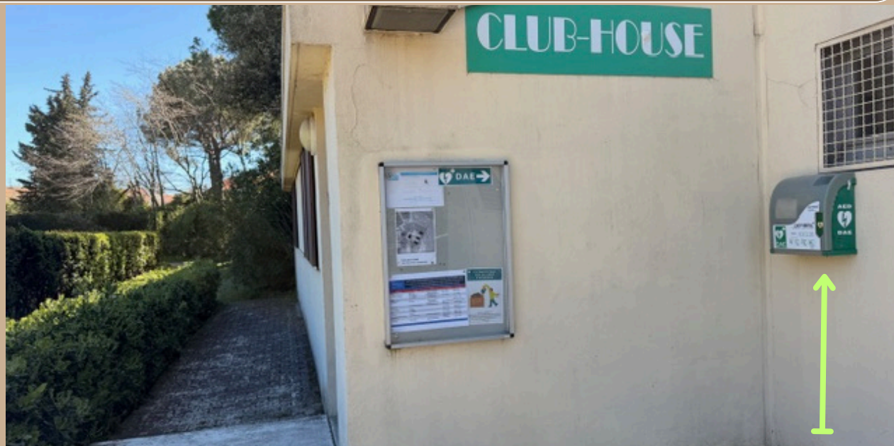
Tableau affichage : agenda des ateliers et animations du Club House - Défibrillateur